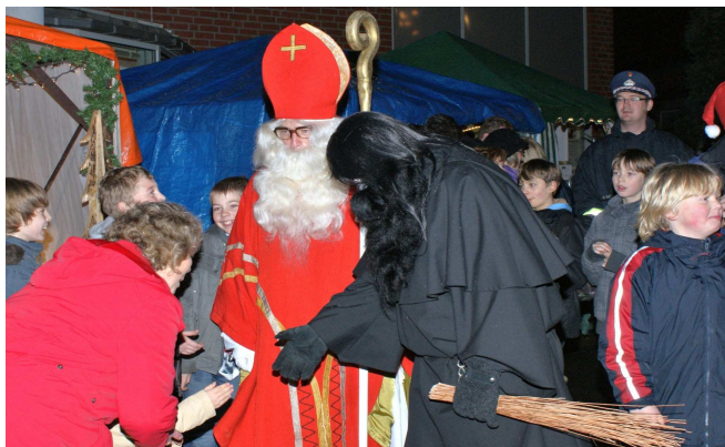
Weihnachtsmarkt in Rhade

Der CDU Ortsverband wünscht allen Lesern ein frohes und gesegnetes Weihnachtsfest, Gesundheit sowie viel Glück und Erfolg für das Jahr 2010 !