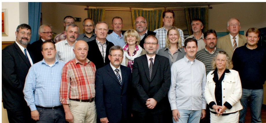
Der neue Vorstand der CDU Rhade